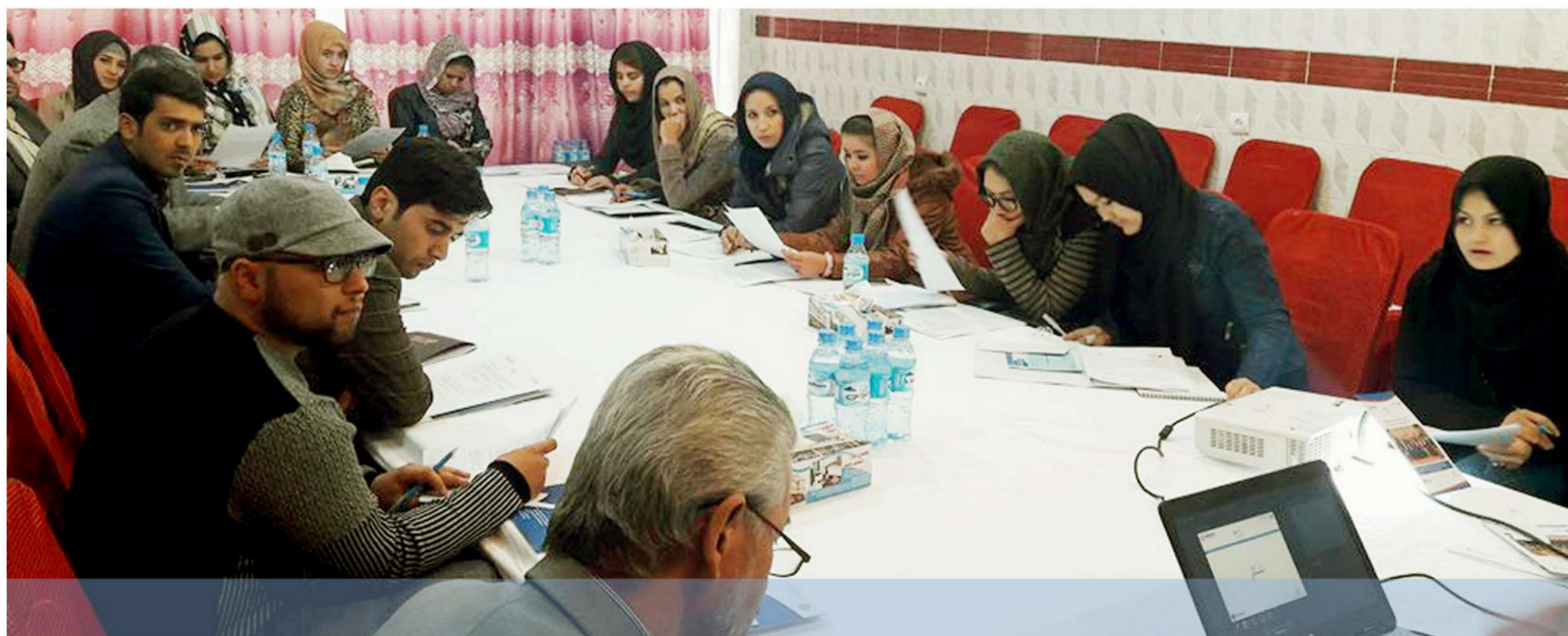
جلسه مشورتی - ۲۴ عقرب، ۱۳۹۶

در پایان برنامه، در مورد نیازمندی ارتقای ظرفیت نهادهای جامعه مدنی که بر اساس ارزیابی مدل تصدیق این انستیتوت بدست آمده است، برای اشتراک کنندگان معلومات ارائه گردید. اشتراک کنندگان تعهد سپردند که موضوع تصدیق نهاد های جامعه مدنی را همراه با اعضای هیئت مدیره و مسوولین دفاترشان مشورت نموده و در مورد درخواست شان به انستیتوت جامعه مدنی در تماس خواهند شد.