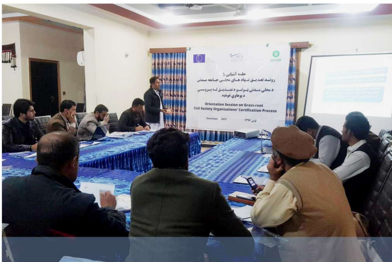
تالقان - مرغومی ۲ هم، ۱۳۹۶

د ۲۰۱۷ کال دسمبر په ۲۳ مه د افغانستان د مدني ټولنو د انستیتیوت لخوا د محلی مدني ټولنو د تصدیق پروسي پوهاوي غونډه د تخار ولایت مرکز تالقان ښار کی ترسره کړه. نوموړې غونډه د قران پاک په څو مبارکو ایاتونو پیل شوه او د مدنی ټولنو د استازو د پیژند گلوی نه وروسته گډونوالو ته د تصدیق د پروسی په هکله اړین معلومات وړاندي شول. په نوموړي غونډه کی د ۱۸ مدنی ټولنو استازو گډون کړی وو او د مدني ټولنو د تصدیق په ټولو هغومعیارونو اړونده بحث وکړ چې د مدنی ټولنو د تصدیق پروسي لپاره اړین دی. پدې هیله چې راتلونکي کی په ملي او نړیوالو معیارونو برابر مدني ټولنو بنسټونه ولرو.