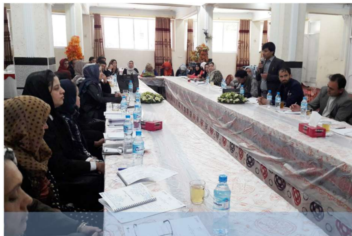
Orientation Session, Dec. 2017, Taloghan

Furthermore, the event provided an opportunity for stakeholders to interact, understand and suggest ways forward to strengthen CSOs’ capacity in areas such as internal governance, project management and program delivery, financial management, communication, and human resource.