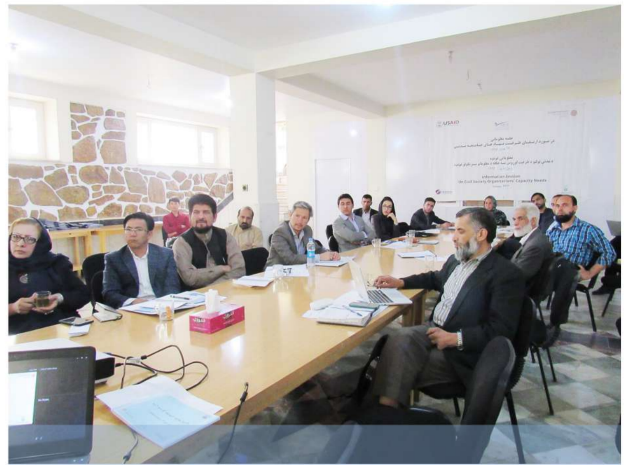
Information Session, Oct. 2017, Kabul

Following the launch of Certification Model for Grass-root civil society organizations (GrCSOs), AICS conducted an orientation session for 18 GrCSOs' representatives including 10 females and 8 males in Herat provinces on 7th of December 2017. AICS representative explained this certification model and its benefits for the effectiveness and credibility of GrCSOs and encouraged the participants to be part of this certification. The participants appreciated the initiative of certification process for GrCSOs and expressed their interest in this model.