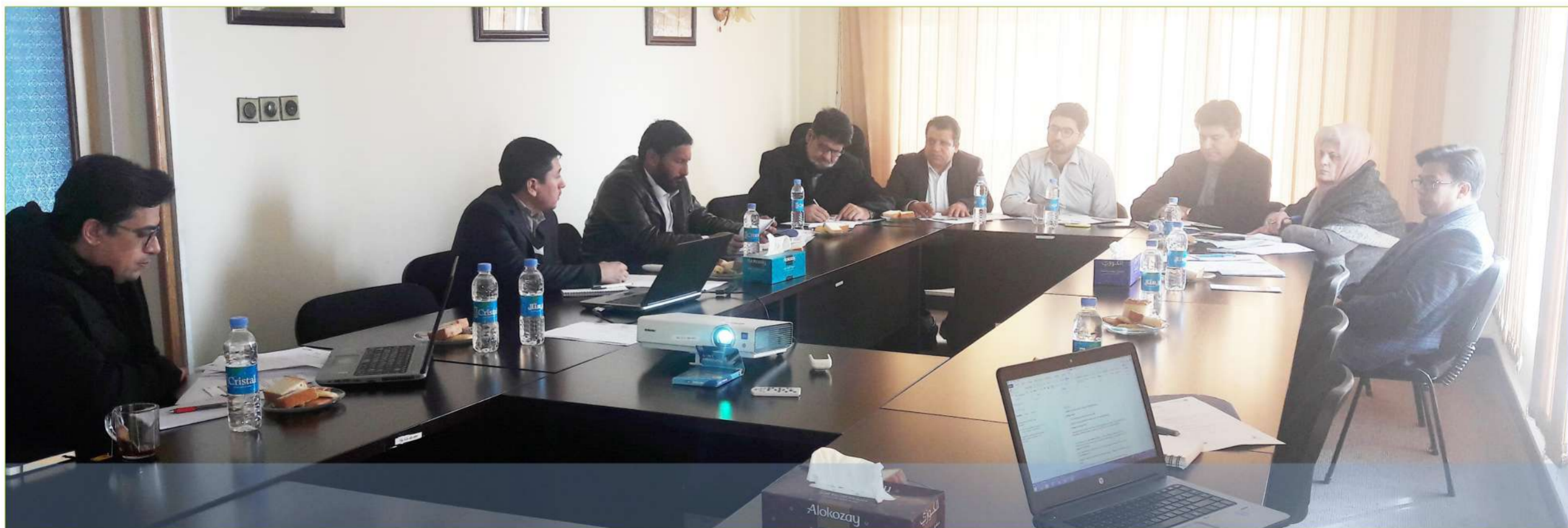
تصویر گرفته شده توسط انستیتوت جامعه مدنی افغانستان، گروه کاری نهاد های تصدیق شده انستیتوت - ۴ جدی، ۱۳۹۶

پنجمین جلسه کمیته رهبری گروه کاری مشترک نهاد های تصدیق شده انستیتوت جامعه مدنی افغانستان با اشتراک اعضای این گروه به تاریخ ۴ جدی ۱۳۹۶ در انستیتوت جامعه مدنی افغانستان برگزار گردید. این گروه به ابتکار انستیتوت جامعه مدنی افغانستان در همکاری با نهاد های تصدیق شده انستیتوت جامعه مدنی افغانستان ایجاد گردیده است. اعضای این گروه شامل نهاد هایی اند که از طرف انستیتوت جامعه مدنی افغانستان تصدیق نامه دریافت کرده اند. نهاد های جامعه مدنی که در آینده از سوی انستیتوت ارزیابی و تصدیق میگردند میتوانند عضویت این گروه را بدست آورده و همانند سایر نهاد ها از امتیازات آن بهره مند گردند.