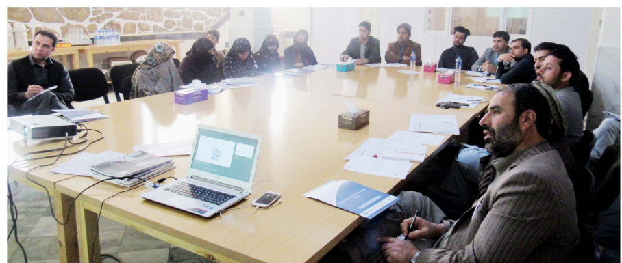
CSOs Credibility and Image in Public, Paktia Province, March, 2018, Kabul

Around 20 male and female representatives of Paktia civil society organizations participated and shared their ideas.