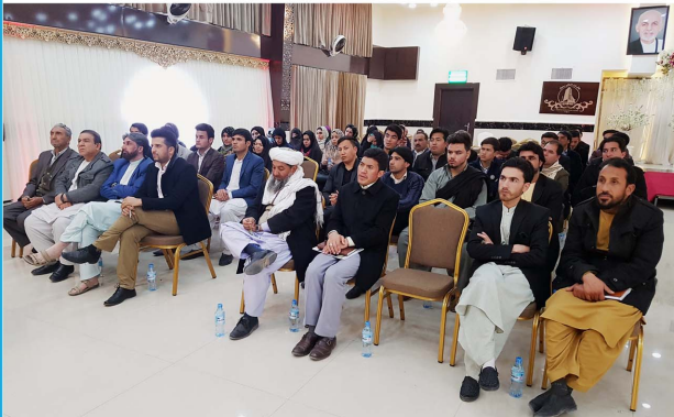
د سیکاراپور د ویشلو ناسته، سلواغه، 1396، هرات، افغانستان

د 1396 کال د مرغومی په 28، د افغانستان د مدنی ټولنی انستیتوت د هرات ښار کې یوه غونډه جوړه کړه تر څو د هرات مدنی ټولنو استازو، حکومتي چارواکو او پوهانو لپاره د 2017 سیکا (په افغانستان کې د مدنی ټولنی لپاره داغیزمن چاپیریال وضعیت) موندنی او خپرونی وړاندې کړه. دا د گډون کولو په ناسته کې د گډونوالو د پراخ گډون سره ښه ومنل شوه. د څیړنو پایله د گډون کوونکو د مهمو ښکیلتیا پر بنسټ وه، او د تحقیق ډیزاین په اړه ځینی مهم پوښتنې ته اشاره وشوه. دا وینا د گټورو تبصرو لپاره خلاصه شوه، او همدارنگه د ځمکې په واقعیتونو او د هغو مسلو په اړه چې د هرات د مدنی ټولنی سازمانونو ورسره مخ دي، څرگندېږي. دا پېښه د سیکاراپور په فارسی، پښتو او انگریزی نسخو په ویشلو سره بشپړه شوه.