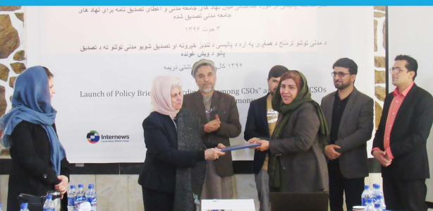
AICS Certificate awarded to AWSDC Representative, Feb. 2018, Kabul

In addition to the Certificates, Afghan Women’s Educational Center (AWEC) received the Best Practice Award on “Human Resources” and Aid Afghanistan for Education (AAE) received the Best Practice Award on “Financial Management”.