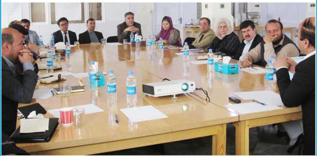
نشست مشورتی پیرامون کنفرانس «هفته ملی جامعہ مدنی» حوت ۱۳۹۶، کابل

در ادامه این نشست اشتراک کننده گان دیدگاه های خود را بر محور موضوع میزگرد مطرح نمودند. آنان با توجه به تجربیات و زوایای دید مختلف خود به تحلیل این موضوع پرداخته و نظرات و پیشنهاد هایی را مطرح ساختند. عدم هماهنگی میان نهادهای جامعہ مدنی، سوء استفاده از نام و اعتبار نهادهای جامعہ مدنی برای اهداف سیاسی، اقتصادی و زبانی، عدم همکاری دولت در اجرای پروژه های انکشافی، عدم توجه به نیازهای مردم در پروژه ها و مسایلی از این دست از عوامل عدم هماهنگی و همکاری میان نهادهای جامعہ مدنی در ولایت سمنگان بیان گردید. همینطور اشتراک کننده گان پیشنهاد هایی را برای هماهنگی و همکاری میان نهادهای جامعہ مدنی این ولایت بیان نمودند.